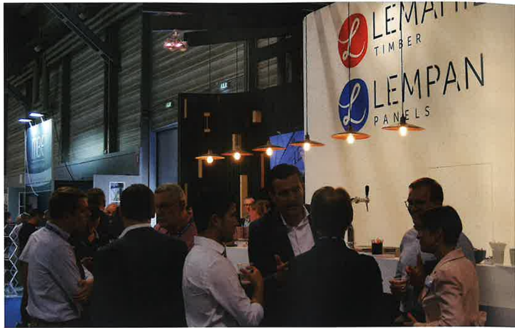
Traditioneel veel Belgische bedrijven op de Franse beurs. Vaak vanwege de internationale toeleveranciers, maar ook omdat er naar Frankrijk geëxporteerd wordt.

FSC Nederland heeft ook een stand op de beurs. Hier staan Nederlandse vertegenwoordigers samen met collega's uit Frankrijk, Afrika en mensen van FSC International. Het team zal vragen van bezoekers beantwoorden over de uitdagingen en voordelen van certificering, de keuze van houtsoorten en over de nieuwe EUDR. Daarnaast organiseert FSC een business matching event om marktpartijen in tropisch hout samen te brengen. FSC wil een platform creëren voor bedrijven in de waardeketen van duurzaam tropisch hout. 'Elkaar ontmoeten, bestaande relaties verbeteren en nieuwe aangaan, dat is ons doel.' Het FSC-evenement staat open voor houtleveranciers (primaire of bewerkte hout), importeurs en distributeurs, en eindgebruikers. Aanmelden hier kan via een mail naar: t.hennekes@nl.fsc.org . Er volgt wel