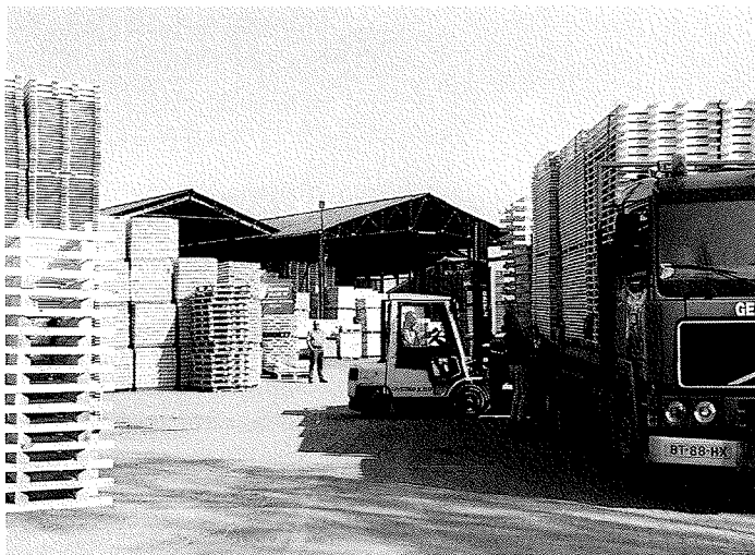
De communicatie tussen bouseigenaren en houtverwerkers is onvoldoende