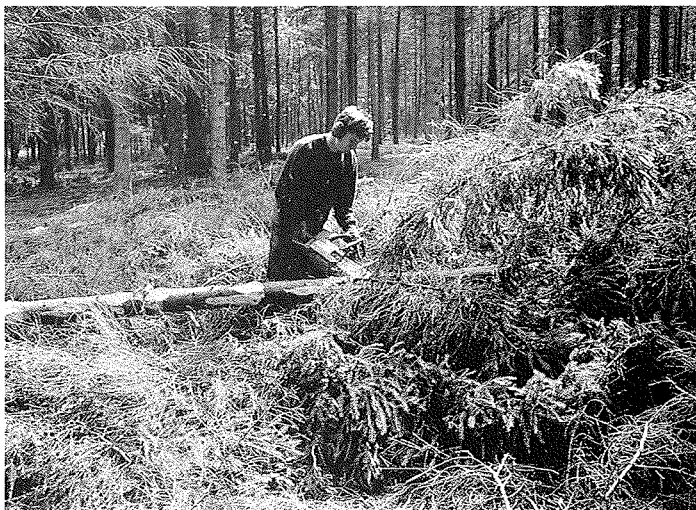
Hout biedt werkgelegenheid aan velen, vanaf de bron tot eindproduct