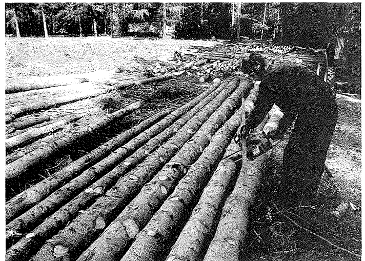
Essentieel is een continue stroom van marktbaar hout

adem met het vernietigen van bos en natuur. Dit negatieve imago remt de ontwikkeling van de Nederlandse bos- en houtketen. Aan de andere kant is er een grote waardering voor het materiaal hout, vindt het beheer van het Nederlandse bos op duurzame wijze plaats en houden bouseigenaren in toenemende mate rekening met de wensen van de maatschappij. Ze dragen bij aan het verhogen van de biodiversiteit en leveren gelijktijdig een van de weinige hernieuwbare grondstoffen.