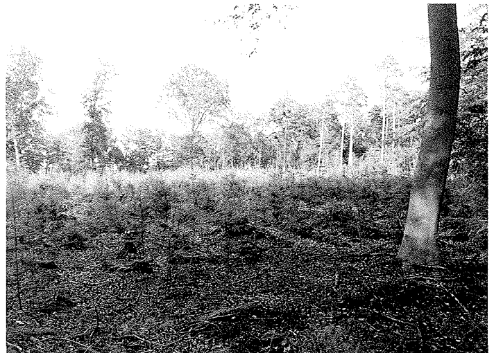
Verjonging en omvorming van slecht groeiend bos vraagt om overheidssteun

mogelijkheden te zoeken kan de sector marktkansen beter benutten en bedreigingen aanpakken.