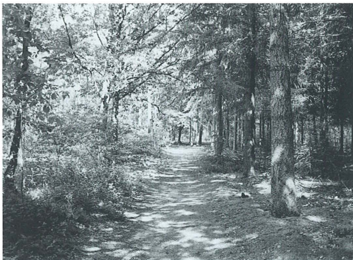
De mogelijkheden om uit het bos hout te oogsten dienen beter te worden benut

© Stichting Bos en Hout – ISSN: 1382-1113