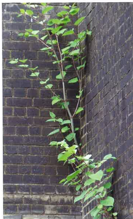
Duizendknoop in kunstwerken.

Aziatische duizendknopen bezorgen veel terreineigenaren en overheden hoofdbreken. De negatieve impact van deze soorten wordt breed erkend en er is behoefte aan een uniform gedragen strategie om duizendknopen te bestrijden en verdere verspreiding te voorkomen. Aequator Groen & Ruimte, Stichting Probos en Geofoxx milieu expertise hebben een landelijk protocol ontwikkeld met handreikingen voor beheersing en voorkomen van verspreiding van Aziatische duizendknopen.