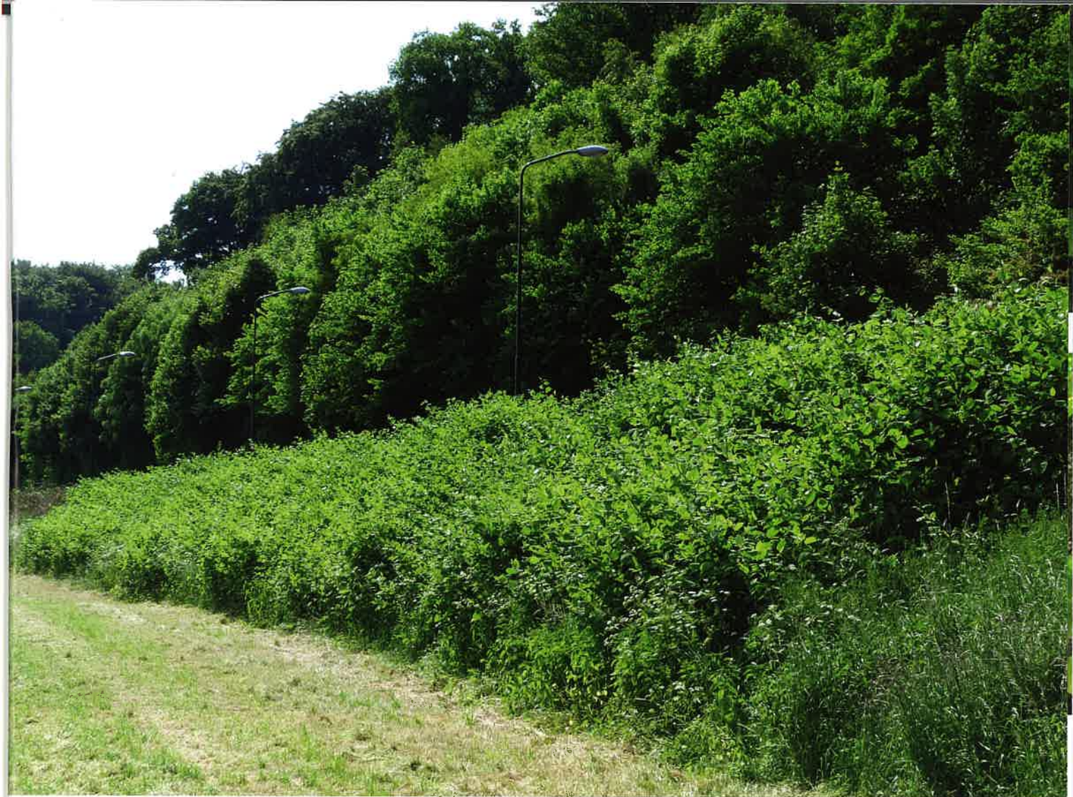
Duizendknoop langs weiland.

Er kan echter in principe nooit 100 procent garantie gegeven worden of een gehele partij grond vrij is van duizendknoop. Wel kan een inspanningsverplichting worden opgelegd om aanvoer van grond met duizendknoopresten te voorkomen. Voor aanvoer van grond kan de bronlocatie gecontroleerd worden op aanwezigheid van duizendknoop in een informatiesysteem van de grondbeheerder of via inspectie in het veld of bij het gronddepot.