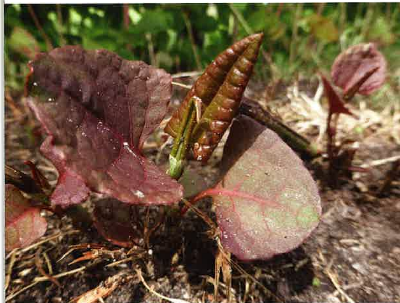
Ontluikende duizendknoop.

zorgvuldigheidseisen, nazorg en monitoring. Samen vormen de infobladen het "Landelijk protocol omgaan met Aziatische duizendknopen". Er worden momenteel nog bestekbepalingen opgesteld voor de onderdelen maaien en grondwerk die toepasbaar zijn in aanbestedingen en contracten.