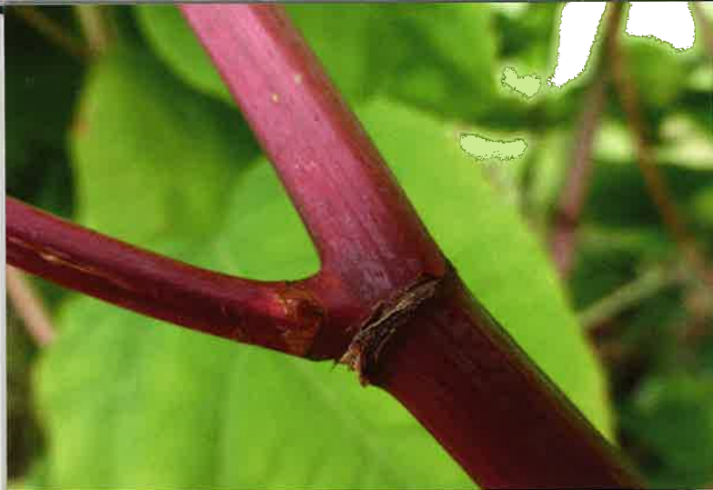
Knoop duizendknoop.