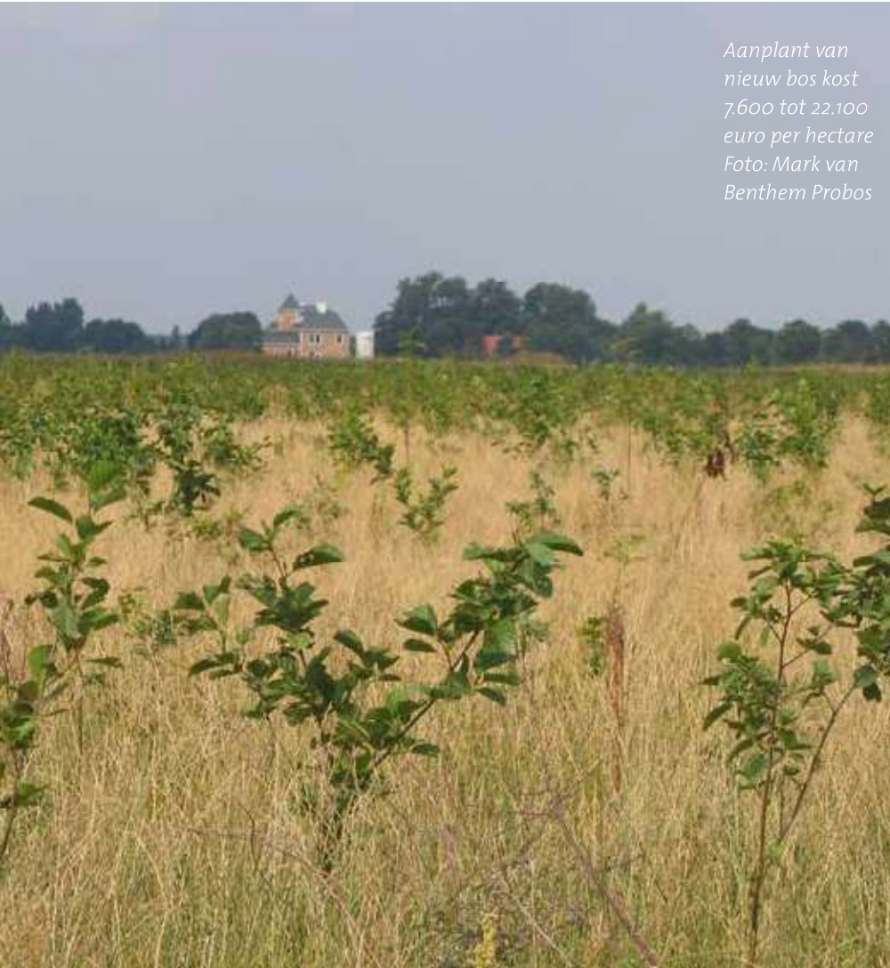
Aanplant van nieuw bos kost 7.600 tot 22.100 euro per hectare